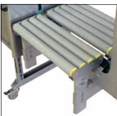
Opties Optimale aanpassing aan verschillende bedrijfsomstandigheden en vereisten