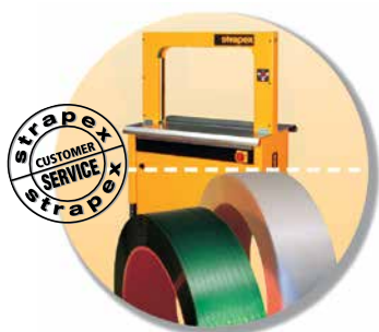
Machine, omsnoeringsband en service als totaalpakket