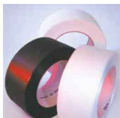
Economisch band voor pakket vriendelijk omsnoeren Gebruik van dun PP-band